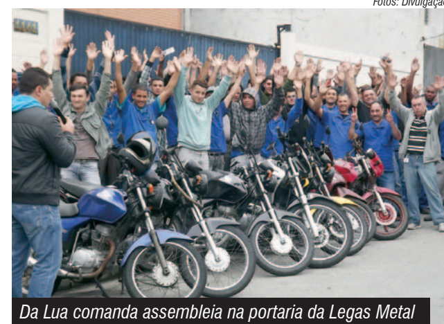
Da Lua comanda assembleia na portaria da Legas Metal

"O impasse acontece porque está bastante difícil negociar", lamentou o dirigente. "Em dois meses, foram quatro reuniões sem avanços significativos", disse.